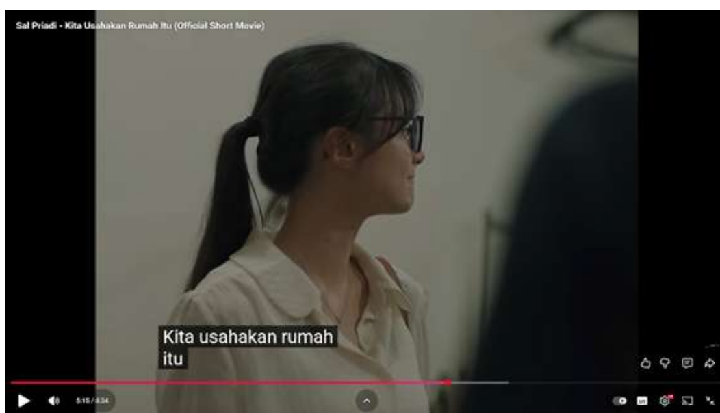
Gambar 3 Cuplikan dialog

Mengandung makna literal (usaha membangun rumah) dan konotatif (usaha membangun masa depan & hubungan bersama).