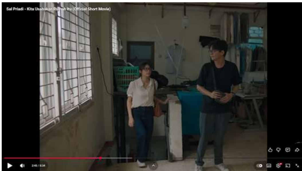
Gambar 1 Cuplikan rumah masa kecil Amel

Rumah masa kecil Amel melambangkan masa lalu dan identitas yang hilang; rumah di sini menjadi tanda kenangan yang tak bisa sepenuhnya dimiliki lagi.